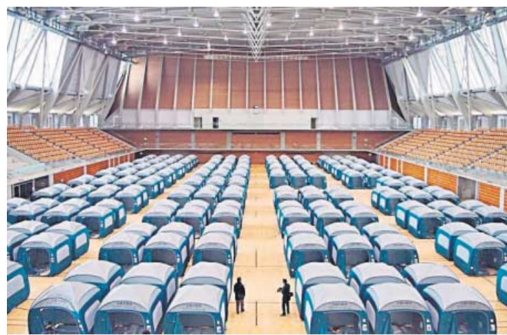
Tiendas de campaña para los evacuados en Ishikawa.

El acceso por tierra al norte de la península de Noto, la zona más castigada por el terremoto, ha