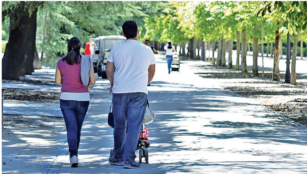
Casi la mitad de los españoles menores de 45 años se plantean a corto plazo formar una familia.

La CNTC estrena el nuevo año con La gran Cenobia , la historia de alguien que lucha no solo en el campo de batalla, sino también para defender su liderazgo en un mundo de hombres que no respetan su posición por ser mujer.