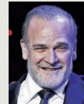
Lluís Homar Director de la Compañía Nacional de Teatro Clásico

Plantear que el pasado, presente y futuro es “ambiguo” y que el pensamiento nos puede llevar donde queramos “sin tener que viajar”, esto es lo que propone con bellas metáforas, en Tótem , un cómic que convierte la vida en un viaje.