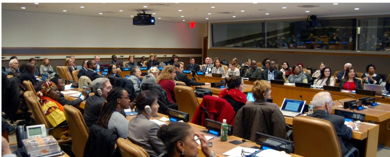
Durante la intervención del autor en el IFFD Briefing en la sede de la ONU (10 Febrero 2016).

Sin embargo, como se muestra en la gráfica anterior, cuando se compara con los resultados de escuelas con importantes programas de participación de los padres en la educación de sus hijos, en la zona de Lekki en el Estado de Lagos, vemos resultados significativamente mejores, con una tasa de graduación de alrededor de un 92 % entre los estudiantes participantes en los exámenes de la Escuela Secundaria.