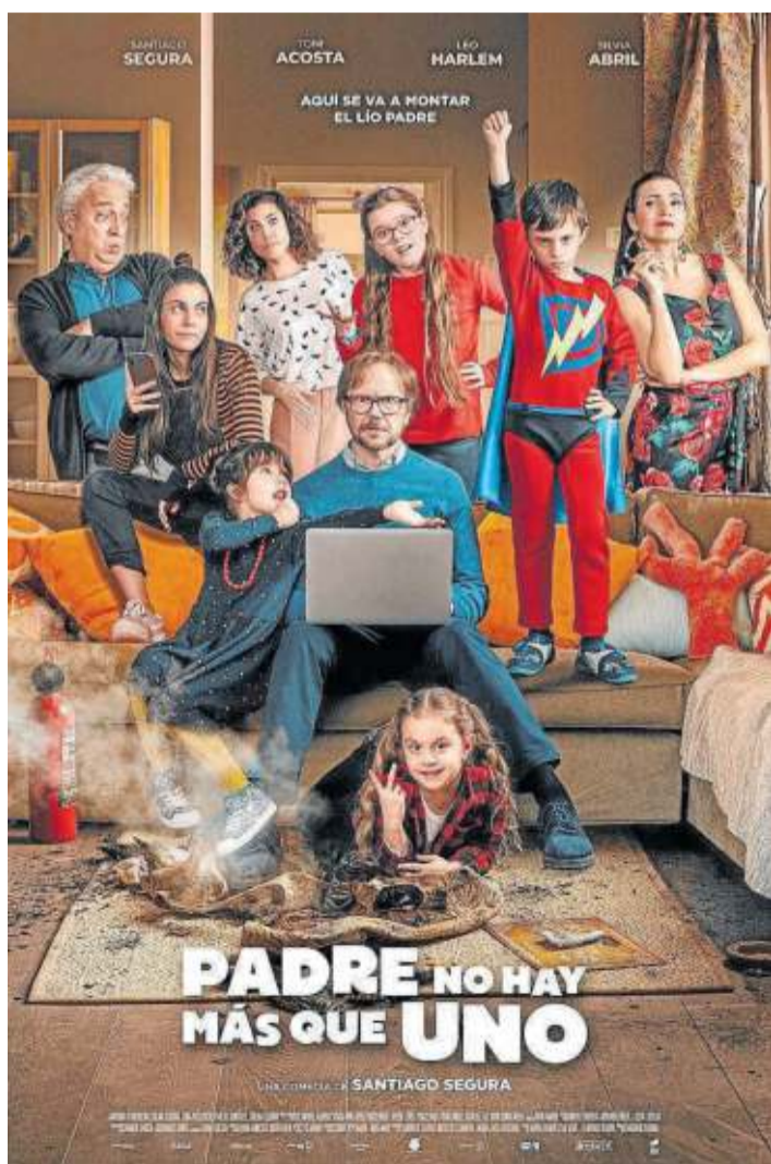
Cartel promocional de ‘Padre no hay más que uno’.

“LA TEMPORADA MÁS LOCA” También aparece por el hotel londinense Tomer Kapon, que hace las veces de Frenchie en The Boys y que no duda en apuntar a los guionistas: “Es la temporada más loca que han creado”. “En las dos primeras los personajes nos sentimos como si estuvié-